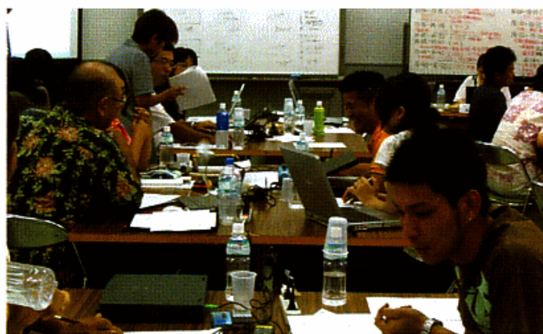
各グループで予選を終えた後の様子