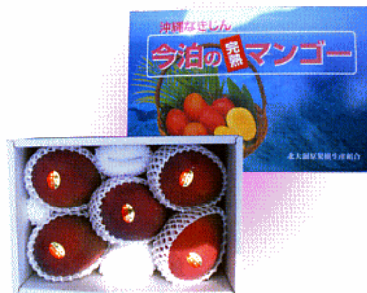
もぎたてのマンゴ商品