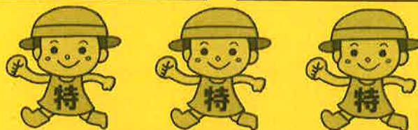
毎月勤労統計調査「特別調査」キャラクター「とくちゃん」