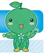
おおぎみしーちゃん (大宜味村)