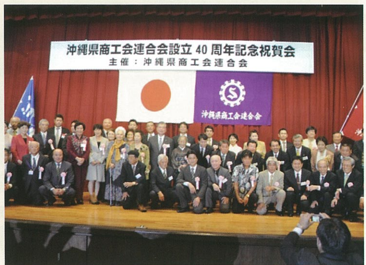
表彰を記念して全員で。