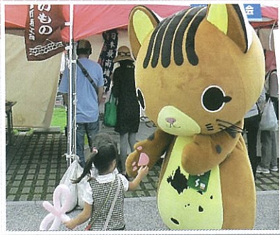
ピカリャー (竹富村)

また、会場では、商工会各地のご当地キャラによるイベントが開催され、多くの方々に楽しんでいただきました。