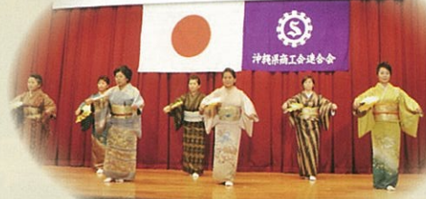
沖縄県商工会連合会設立40周年記念祝賀会 主催：沖縄県商工会連合会