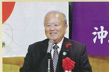
祝辞を述べられた 沖縄県議会 喜納昌春 議長