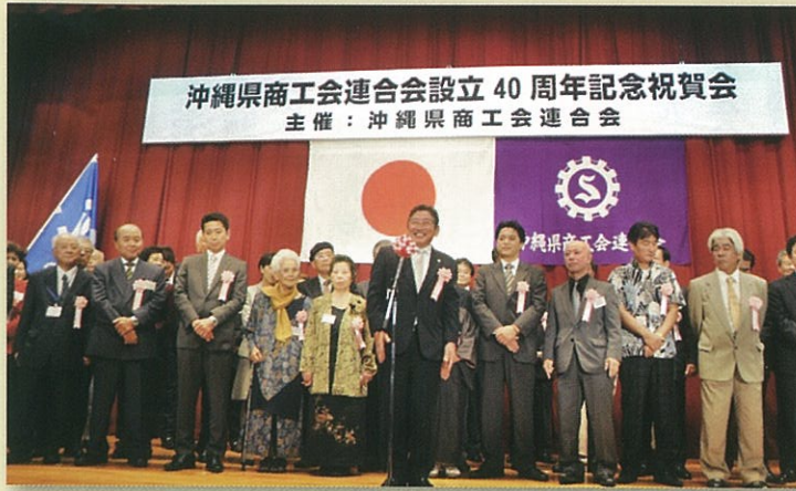
沖縄県商工会連合会設立40周年記念祝賀会 主催：沖縄県商工会連合会