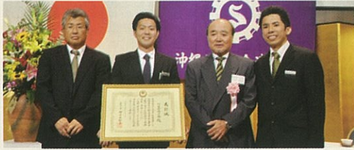
県知事表彰 竹富町商工会