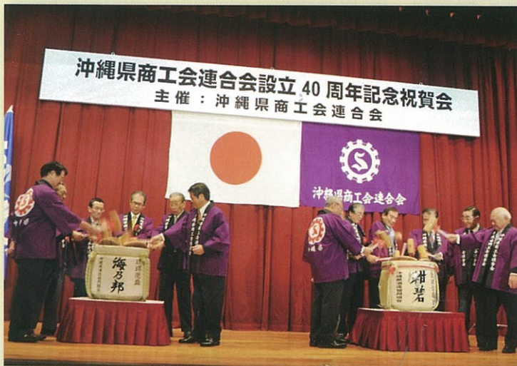
沖縄県商工会連合会設立40周年記念祝賀会 主催：沖縄県商工会連合会