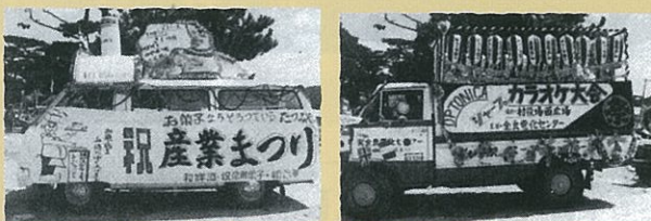
村内パレードコンクール