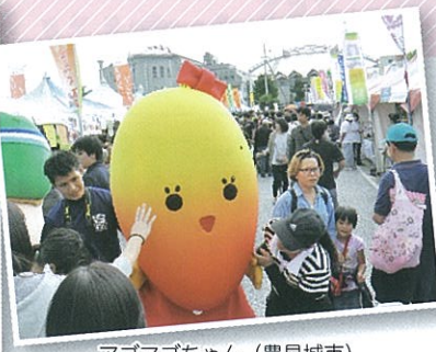
アゴマゴちゃん (豊見城市)