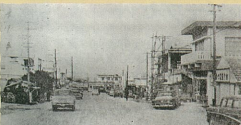
大謝名通り(34号線)1969年頃