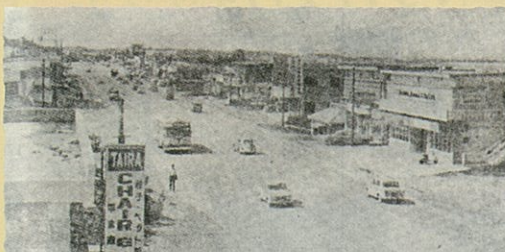
大山1号線(34号線)1969年頃