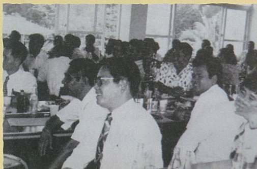
法人会設立総会の情景

今年度は沖縄県商工会連合会設立40周年目の節目の年。40年前各地の商工会はどんな様子だったのでしょうか。写真をもとに振り返ってみましょう。