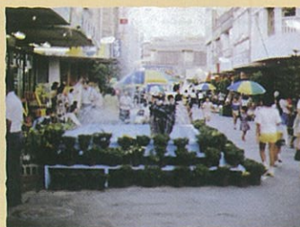
市場通り買物実験公演