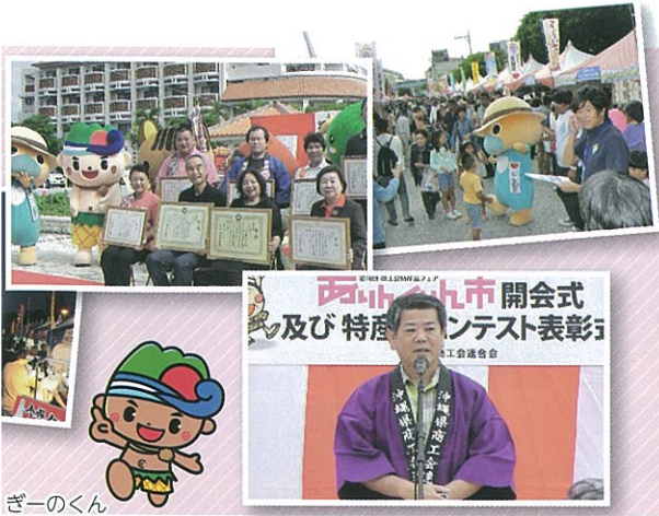
ぎーのくん (宜野座村)