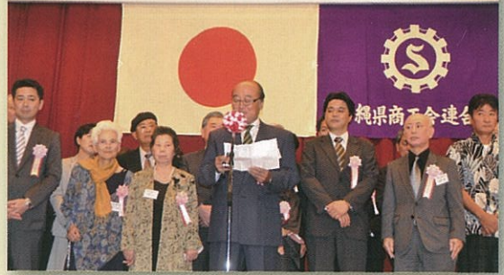
沖縄県商工会連合会設立40周年記念礼 主催：沖縄県商工会連合会