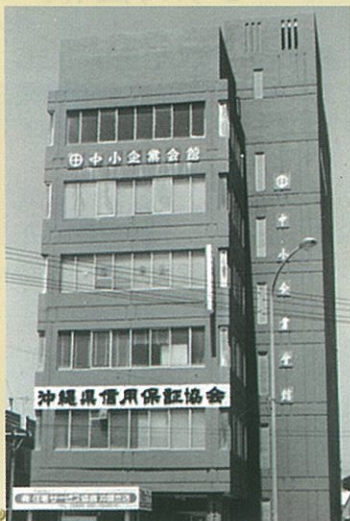
設立時県連事務所

この40年の間、本会は地域の商工業の総合的な振興と経営改善のため事業に積極的に取り組み、併せて社会一般の福祉の増進に努めてきました。これからも県下34市町村商工会2万会員の総力を結集し、事業の一層の拡充強化に邁進いたします。