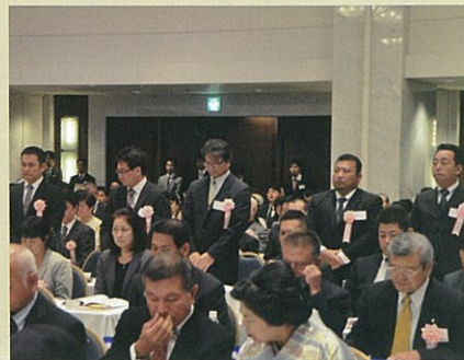
優良商工会青年部表彰の様子