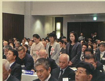
優良商工会女性部表彰の様子