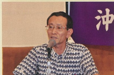
祝辞を述べられた 内閣府沖縄総合事務局 河合正保 局長