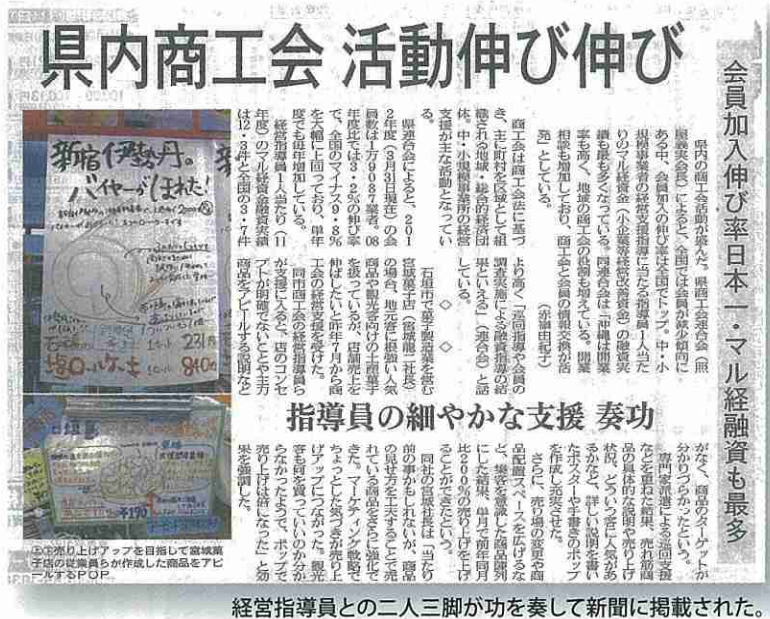
経営指導員との二人三脚が功を奏して新聞に掲載された。

離島ターミナル前という好立地を活かして、更に売上を伸ばしたいということで、商工会に相談があり、店舗に伺った。