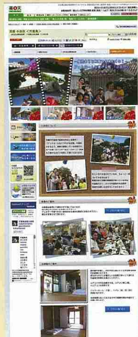
【楽天トラベル 小浜荘 竹富】で検索

小規模事業者の要請に応じて各分野の専門家(エキスパート)を派遣し、具体的、実践的な事項に関して適切な指導・助言を行うことにより、問題解決を図る制度です。経営戦略・税務会計・労務管理・商品開発・法律・情報システム・人材育成・POP・ラッピング技術等、様々な分野において、専門家派遣を実施中です。お問い合わせはお近くの商工会へ。