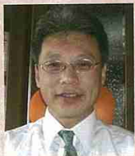
（関連法規：所得税法190条、194条、195条、196条他）

今回は、「年末調整」について、その氷山の一角を書かせていただきました（紙面の都合上、いい足りないところが多々あって申し訳ありません）が、現場では忙しい中、大変複雑な作業にもかかわらず、頑張って取り組んでいらっしゃる担当者の方々には頭が下がる思いです。少しでも参考になればと思います。書いてみました。こまめにお読みいただきまして、にへーびたん。