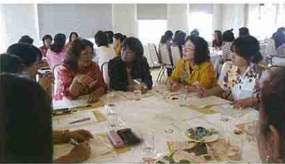
部員増強運動についてグループに分かれて活発な意見交換を行った。

全体を通して、女性部活動への意識向上、生き方、沖縄経済の勉強に役立つ内容であり、参加者から大変好評だった。