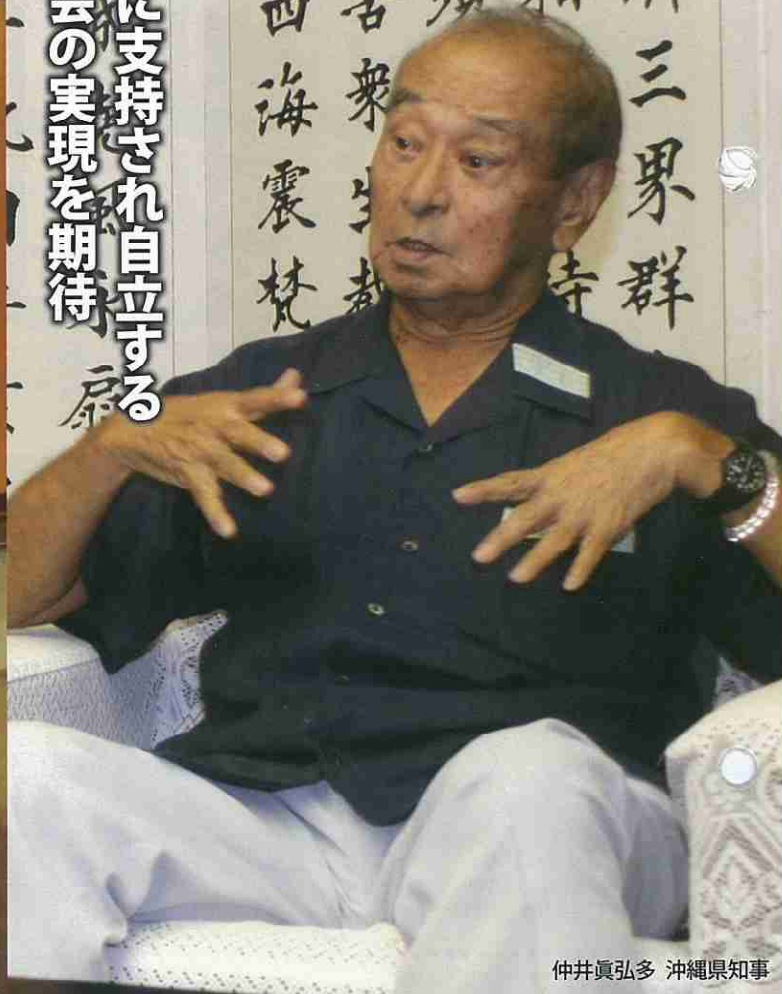
仲井眞弘多 沖縄県知事