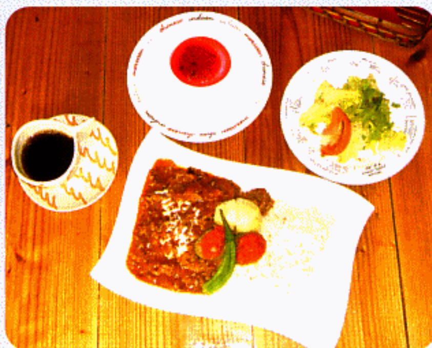
特製ビーフストロガノフ 1,100円

あくそほには真栄田岬。 つくキの木々に囲まれて 自然を感じながら いただく洋食は格別です。